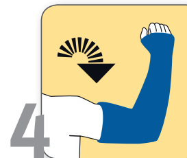
4 Arme anheben und Bewegungen im Schultergelenk durchführen