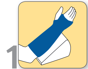
1 Arm hoch halten oder hoch lagern

Es ist wichtig, alle freien Gelenke möglichst oft zu bewegen. Die folgenden Übungen sollen die Heilung unterstützen: