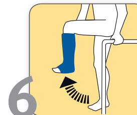
6 Bei freiem Knie: mehrmals täglich Bein bis zu zehnmal in Knie und Hüfte beugen und strecken