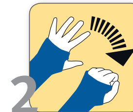
2 Freie Finger mehrmals täglich strecken und zur Faust schließen