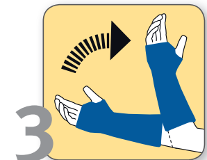
3 Arm seitlich abspreizen und bis zu zehnmal beugen und strecken